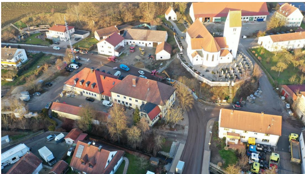
Foto 1: Fertigstellung der Stützwand im Bereich der Kirche (Bauabschnitt 3).